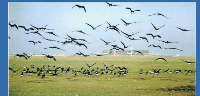
Frühling: die Halligen sind Rast- und Brutplatz vieler Vogelarten

Die 10 bis 956 Hektar großen Halligen sind Reste des Festlandes und von Inseln, die nach den großen Sturmfluten übrig geblieben sind. Auf den 10 Halligen wohnen insgesamt nur zirka 400 Menschen. Sie leben hauptsächlich von Tourismus und Küstenschutz, sowie Viehzucht auf den fruchtbaren Salzwiesen.