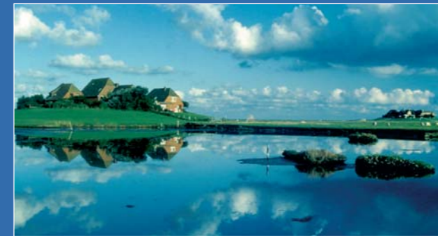
Hooge: auf der Warft stehen die Häuser im Trockenen

Die Halligen sind kleine Inseln, die mehrmals im Jahr überflutet werden. Die Häuser stehen dicht beieinander auf künstlich aufgeschütteten, meterhohen Hügeln, den sogenannten Warften, so bleiben die Häuser in der Regel trocken. Bei extremen Sturmfluten, wenn auch die Warften überspült werden, bringen sich die Bewohner auf dem Dachboden in Sicherheit.