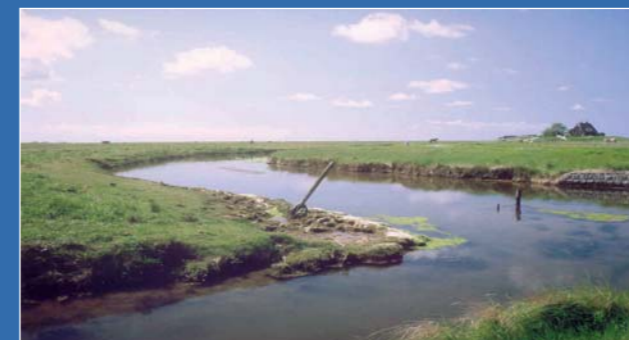
Halligen: Himmel, Wasser und Wiesen

Die Nummer 1 im Halligtourismus wird rundum durch einen 1,50 m hohen Sommerdeich geschützt, dadurch nur 2-3x jährlich „landunter“. Hooge ist ausschließlich mit dem Schiff zu erreichen. 120 Einwohner, 240 Gästebetten, im Sommer bis zu 1000 Tagesbesucher, Wattwanderungen, Film- u. Diavorträge, Konzerte und Lesungen, neu eröffneter Natur- und Kulturlehrpfad